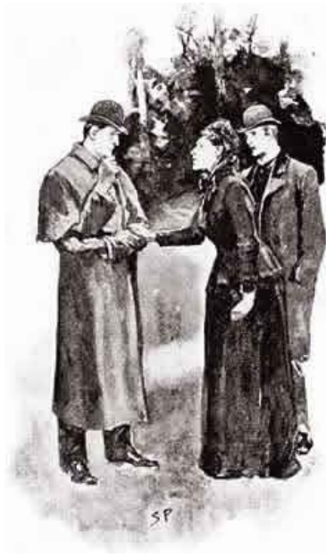
figura sobresaliendo junto a la menuda figurilla del muchacho que guiaba el coche. El cochero tuvo

alguna dificultad para abrir las pesadas puertas de hierro, y pudimos oír el áspero rugido del doctor y ver la furia con que agitaba los puños cerrados, amenazándolo. El vehículo siguió adelante y, pocos minutos más tarde, vimos una luz que brillaba de pronto entre los árboles, indicando que se había encendido una lámpara en uno de los salones.